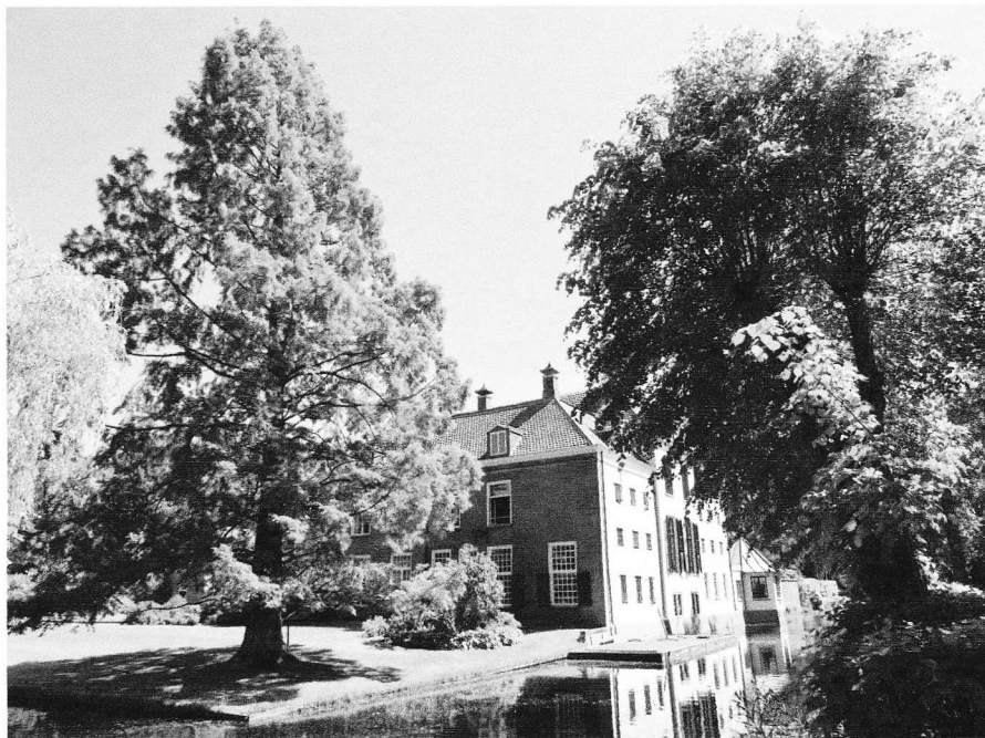
Afb. 5. De cypres geplant op de noord-westhoek binnen de gracht van Schoonheten – geplant ter gelegenheid van het huwelijk Bentinck van Schoonheten-Coldeweij in 1979.

Informatie mede met hartelijke dank aan de Nieuwsbrief van Stichting Archiveriaat Bentinck-Schoonheten.