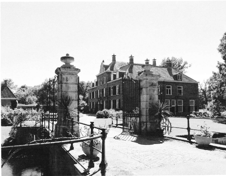
Afb. 3. Schoonheten – sinds de bouw in de 17e eeuw altijd bewoond door Bentincks.