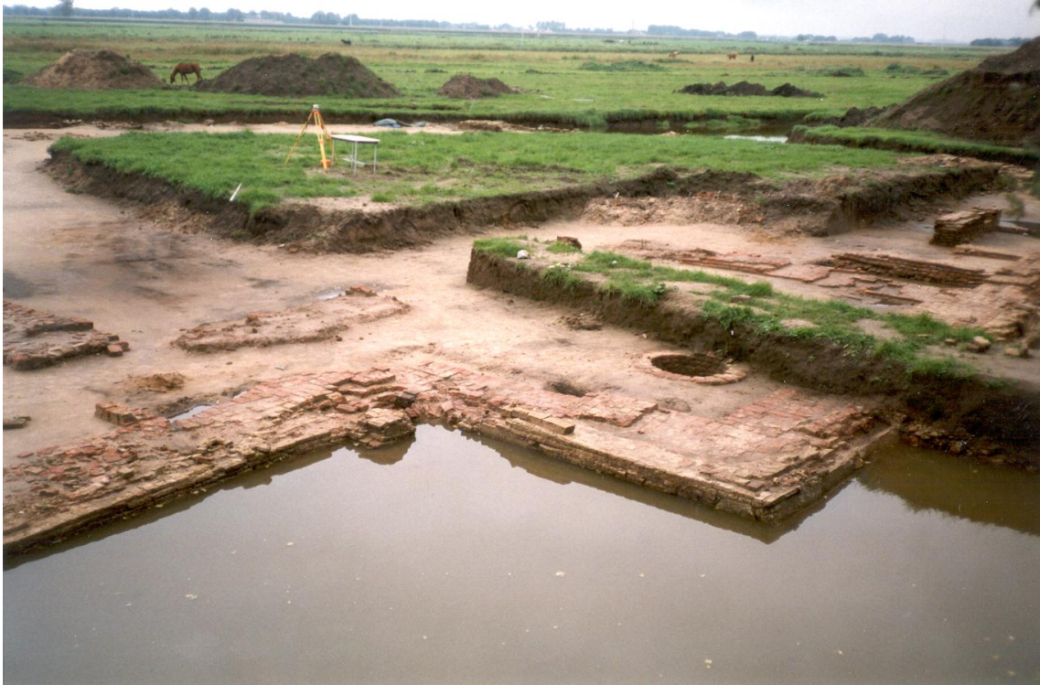
Fundamenten van de hoek van de L. (de zwanehals) Zichtbaar is een waterput en in de hoek de aanzet van het toilet.