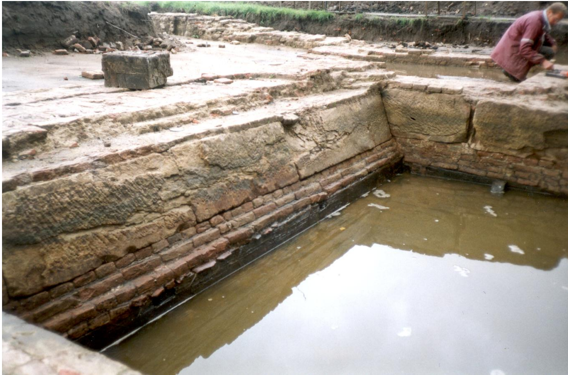
Detail van de fundering op houten palen. Zichtbaar zijn de balken in de lengte van de muur en de donkere vlakjes zijn de verbindingsbalken, daarop metselwerk waarvan de bovenkant het hoogteverschil van de paalfundering moet wegwerken. Daar bovenop blokken van Bentheimerzandsteen.

Niet alleen de landelijke en regionale media hebben belangstelling voor de vondst, bij de opgravingen zelf komen ook veel belangstellenden. Dat laatste is niet altijd een onverdeelde genoeg. Coinhunters, mannen en vrouwen die met detectoren naar munten e.d. op zoek gaan, hebben er al huisgehouden. Een paar hekwerken zijn vervolgens geplaatst, maar hebben rondom het gehele terrein neerzetten was te kostbaar. Het zou het volledige onderzoeksbudget opsouperen. Eigenlijk zou, zoals ook in Nijmegen is gedaan, verboden moeten worden op een archeologisch terrein te komen.