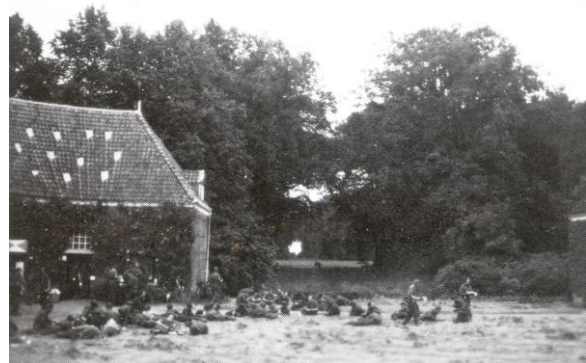
Canadese militairen op het plein van Schoonheten.