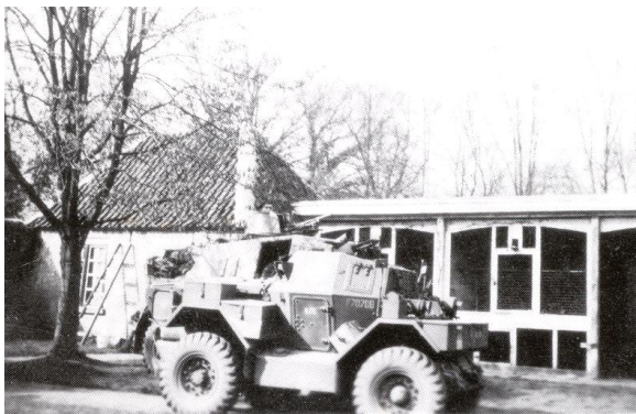
Canadese voertuigen op het plein, voor de volière, van het huis Schoonheten.

De bevrijders waren geen Engelsen. Op een briefkaart van 28 mei staat: “Wij zitten hier vol met Canadezen, 8 officieren in huis, waaronder een majoor, 160 man, tal van vrachtwagens etc. t Zijn engineers, ze brengen heel veel mee uit Duitsland. `t Ligt overal vol prachtige nieuwe planken, grote stapels en materiaal voor bruggen. De majoor slaapt op Okies kamer. Nu is het avond, het plein is vol soldaten; ze zijn aan t eten, wel honderd. Ze zitten in t gras, een aardig gezicht.”