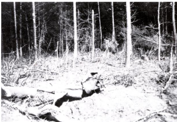
Restanten van een V1 raket. Schoonhetenseweg.