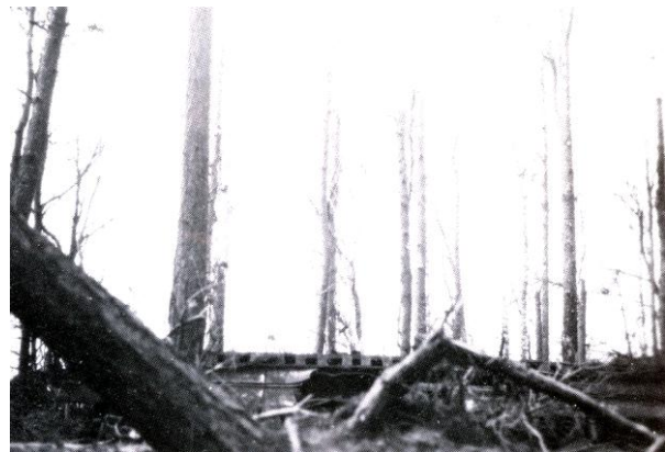
Restanten startbaan V1 raketten, tussen Hoekersdijk en boerderij het Wormer, westzijde van de Schoonhetenseweg.

Dan komt er ook werkelijk inkwartiering - en gaat weer. Een brief van 27 oktober 1944: "Plotseling na 3 weken en 2 dagen vertrok de inkwartiering. Ze waren aan het weggaan toen er alweer een Hauptmann van de SS voor mij stond, hij wilde kamers zien. Hij dacht er over om het weekend met vrienden te komen jagen of met 100 man. Ook dacht hij hier een Casino van het huis te maken. Hij plakte een papiertje op de voordeur met 'belegt' en een nummer. Het is nu twee weken later; hij is niet verschenen en de SS is uit Raalte weg. Raalte wordt nogal eens gebombardeerd, vooral de brug, die niet geraakt wordt, maar de bevolking heeft er van te