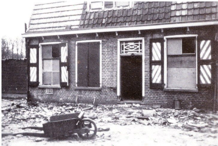
Veel glas en pannen schade aan het "Winkeltje" aan de Schoonhetenseweg.