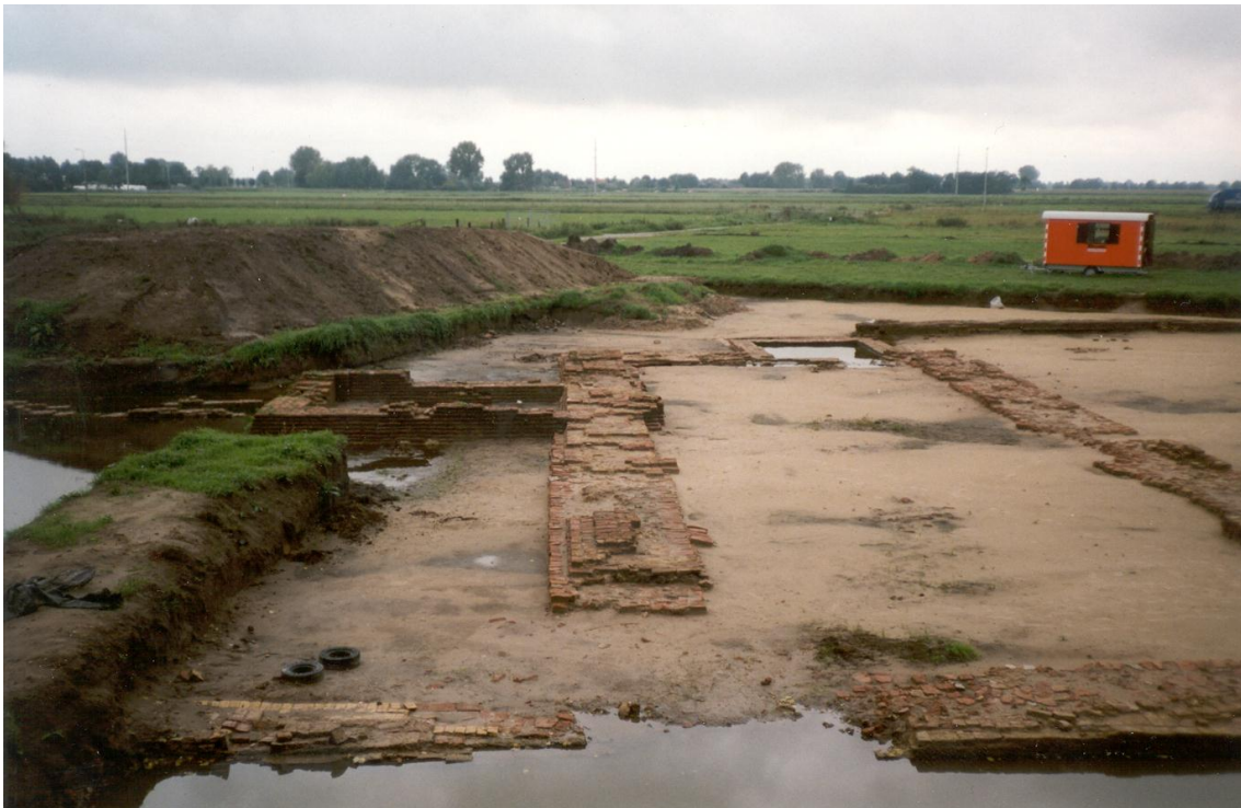
Hier het metselwerk van de funderingen van de muren van het hoofdgebouw. Het bestaat voor een groot deel uit hergebruikt materiaal. Waaronder tufsteen en kloostermoppen daterende van voor 1300. Ook de gemetselde aanzetten van de keldergewelven zijn zichtbaar.

Dit betekende dat men op het terrein van de voormalige havezate Werkeren heeft te maken met overblijfselen uit drie bekende perioden: 1410 – 1521, 1521 – 1800 en 1800 – 2001. De eerste bestrijkt de periode van het kasteel Werkeren zoals deze is bewoond door de Van Ittersums, de tweede die van de havezate Werkeren, bewoond door de Bentincks en de derde, de periode van de boerderij Werkeren van de familie Reuvekamp. Daarnaast is het mogelijk dat er een bouwfase gestaan heeft tussen circa 1360 en 1410 en uiteindelijk is het mogelijk dat er zelfs prehistorische resten bewaard zijn gebleven.