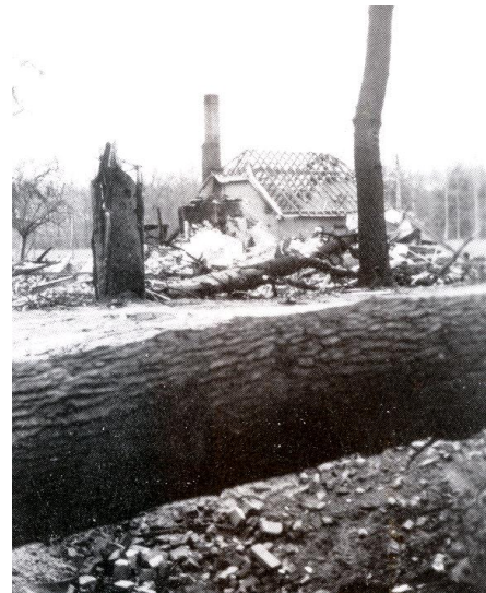
De totaal verwoest "Smederij" naast het Winkeltje.

Door de oorlogshandelingen verdreven kwamen er meer mensen op Schoonheten te wonen, evacuees uit Raalte en uit de naaste omgeving. "Binnen de poort", niet voor zover ik kan nagaan, binnen het huis zelf. En meerdere malen kwam er ongewenst bezoek. Dan is er sprake van dat Schoonheten door de Duitsers gerequireerd zal worden of dat er troepen moeten worden ingekwartierd; uit een brief van 18 augustus 1943 blijkt dat zo een bezetting al viermaal bedreigd heeft, maar dat het tot dien daar ook bij gebleven is. Op een nacht [wanneer?] is er een overval.