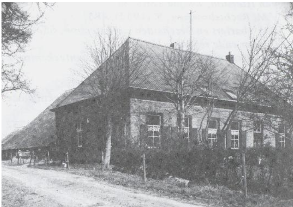
Boerderij Werkeren in 1980.

Het huis Werkeren werd al lange tijd niet meer door de Bentinck bewoond. Zij verkozen het comfortabelere Wittenstein bij Kamperveen. Na het overlijden van Coenraad Willem Bentinck in 1801, hadden zijn erfgenamen,