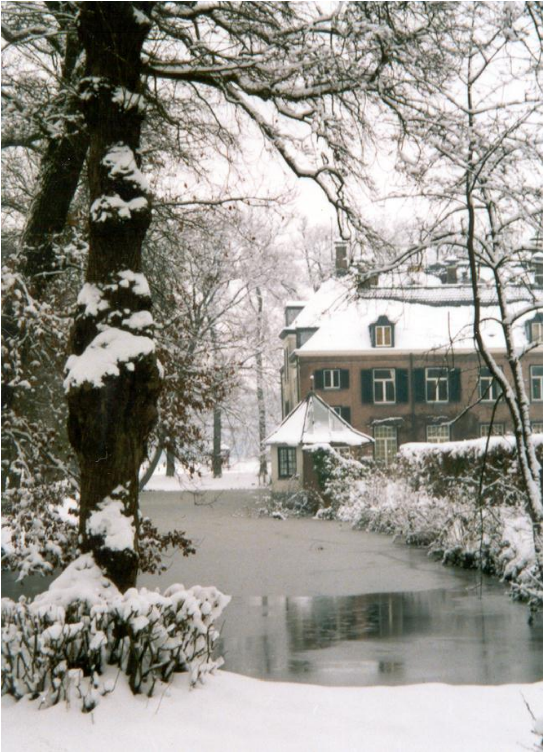
Schoonheten in wintertooi, februari 2001.