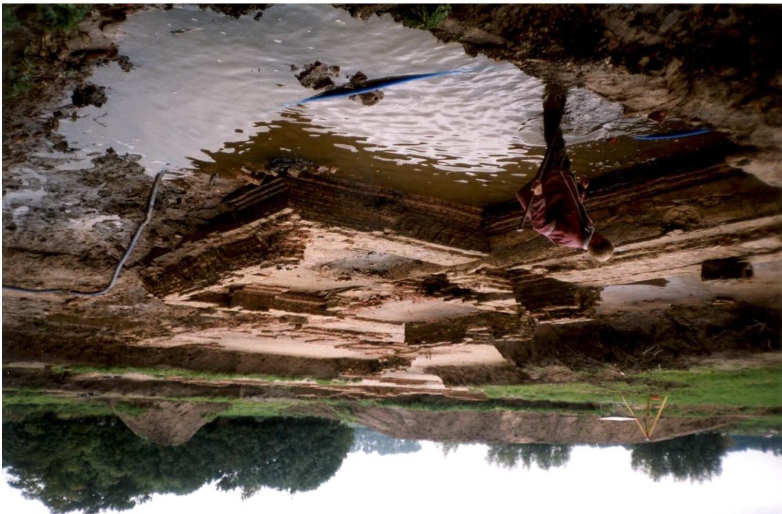
De puist is de fundering van de hoofdingang. Deze ingang is gezien de fundering en de aansluiting van het metselwerk op het hoofgebouw er later tegen aangebouwd.