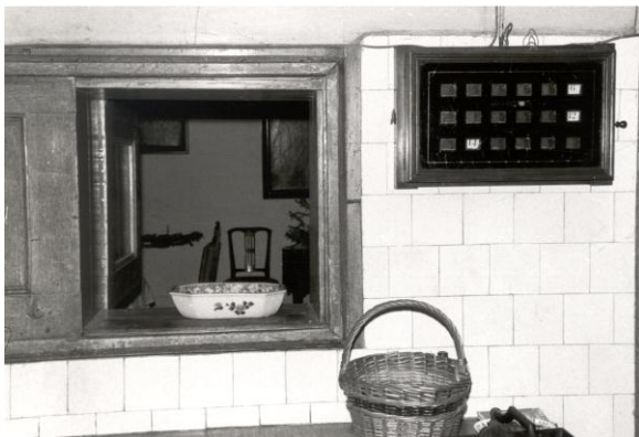
Doorgeefloket met belbord keuken Schoonheten 1964.

Bediende zijn betekende ook heel veel lopen. Eigenlijk vreemd dat woord "bediende", want wie in dienst was, werd niet bediend maar was de dienende, en dienen is lopen. Van de werk- en dienvertrekken in de noord-westhoek van het huis, dat de uitvalsbasis van het personeel vormde, naar al die andere vertrekken van "de familie" en weer terug. Om te brengen en te halen. Om des avonds de bedden open te slaan en des ochtends op te maken, om de gordijnen te openen en de gordijnen te sluiten, om op te dienen en af te ruimen, voor koffie en thee, de zoutjes bij de borrel, de koffie na tafel, nog een warme drank voor het naar bed gaan of iedere andere keer dat mevrouw belde. Ik vraag mij af of mijn grootmoeder ooit, zoals ik, de dag is begonnen door de gordijnen van haar slaapkamer open te trekken of dat dat altijd voor haar is gedaan - gelijk met het eerste kopje thee van de dag. En ik kan me niet herinneren dat zij ooit 's avonds bij het donker worden zelf de luiken sloot en de gordijnen dicht trok. Daar was iemand anders voor, ook toen ze praktisch alleen woonde.