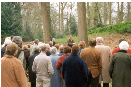
Bij de IJskelder.