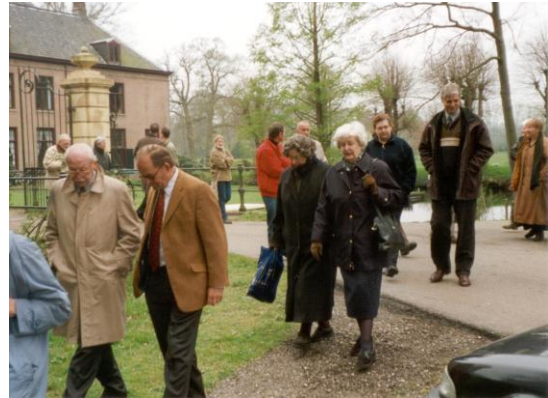
En nu allemaal op pad.

Is er over de Stichting niet zo veel nieuws, over het huis Schoonheten des te meer. Afgelopen zomer is begonnen met de restauratie van de achtergevel. Een hele klus die uitgevoerd wordt door aannemingsbedrijf Hanzebouw BV uit Zwolle. Dit bedrijf heeft al veel historische gebouwen gerestaureerd en hun specialistische kennis is beslist noodzakelijk. Er moest bijvoorbeeld een steiger in de gracht gebouwd worden. Bij de restauratie deden zich nogal wat verrassingen voor. Een leuke ontdekking was dat in het oude lood van de dakkapellen de naam van de dakwerker en de datum, waarop het was aangebracht, staat gegraveerd. De zijkanten van de dakkapellen zijn nu opnieuw bekleed, nu met koper. Het oude lood met de inkervingen wordt door ons bewaard.