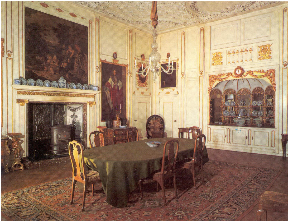
Kasteel Amerongen, eetzaal. Ansichtkaart collectie W.Hoogeland.

Het bestuur wil op deze wijze het behoud van het Kasteel Museum Amerongen veilig stellen. Het besluit is genomen na nauwgezet overleg met externe adviseurs en vertegenwoordigers van de overheid.