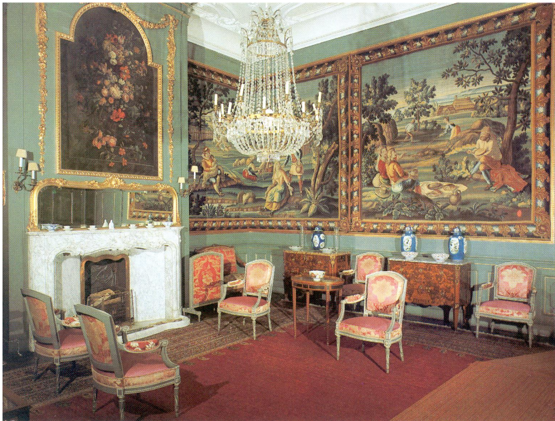
Kasteel Amerongen, gobelinkamer. Ansichtkaart collectie W.Hoogeland.

Het bestuur is tot de conclusie gekomen dat de Stichting beslist niet in staat zal zijn de eigen bijdrage (30% van de te investeren bedragen) die bij de rijkssubsidiëring van dergelijke projecten hoort, zelfstandig op te brengen