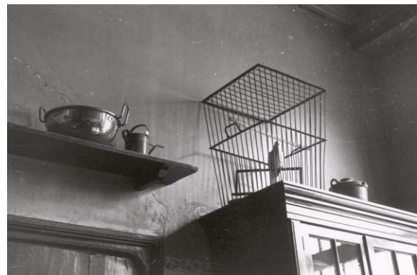
Keuken Schoonheten 1964.

Het was in vroeger tijd niet zo dat een gast even naar de keuken liep om te vragen of hij of zij helpen kon, ik denk ook niet dat hij of zij daar welkom zou zijn geweest. Dat iedereen voor het gemak of voor de gezelligheid bij elkaar aan tafel schoof was al helemaal ondenkbaar. De werelden waren