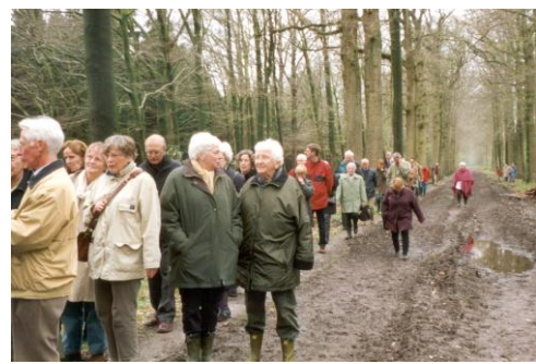
Op weg naar de restanten van de VI startbaan.