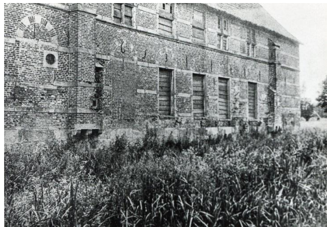
Aan de achterkant dicht gespijkerde vensters.