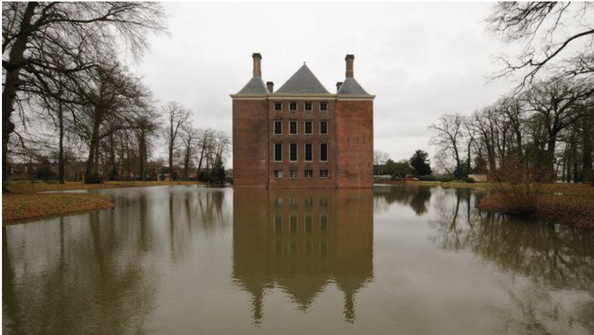
Kasteel Amerongen, achterzijde.

Na bijna 10 jaar restaureren kan kasteel Amerongen weer worden bezocht. De opening van het opgeknapte kasteel is enkele dagen uitgesteld vanwege technische problemen. Op 18 juni van het afgelopen jaar is het einde van de restauratie gevierd met genodigden zoals de commissaris van de koningin van de provincie Utrecht en met ingang van 1 juli kan het publiek weer naar binnen. De restauratie van het kasteel kostte zo'n 20 miljoen euro. Dat geld kwam met moeite bij elkaar. Zo was er in april 2009 nog een tekort van 4,5 miljoen euro waarvoor uiteindelijk de provincie Utrecht garant stond.