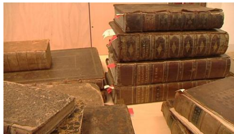
Boekrestauratoren conserveren de boeken in de bibliotheek.