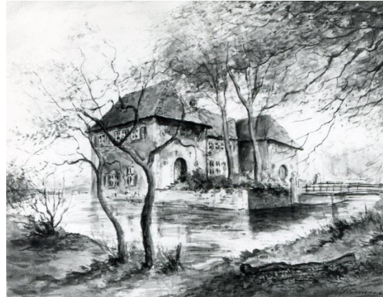
Het Huis te Breckelenkamp heeft vele kunstenaar geïnspireerd. Links pentekening door Martin de Groot, Ommen 1984. Rechts een aquarel van de hand van Tonnie Anconé, Oldenzaal 1974.