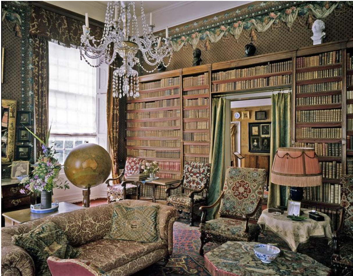
De bibliotheek van Amerongen.

Voorbeelden zijn een statenbijbel met kalfsleren band (1650), waarin de handschriften zijn aangetroffen van leden van de familie Van Reede, een tweedelige landatlas van de beroemde Nederlandse cartograaf Johannes van Keulen (1724) en The Gardeners Dictionary (1759), geschreven door de Engelse botanicus Philip Miller.