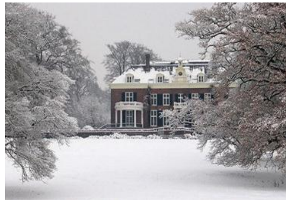
Dekema State te Jelsum en Rhederoord te Rheden.