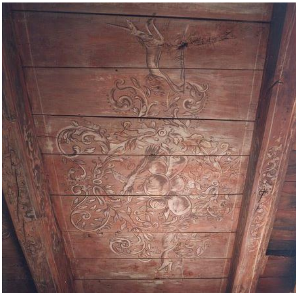
Geschilderd plafond in de opkamer uit de 16 e eeuw.

Het zestiende-eeuwse plafond in de opkamer bleek in 1991 door voortdurende lekkages ernstig aangetast. Er zat schimmel in het hout en het schilderwerk was losgeraakt van de ondergrond, Restauratie zou een kostbare aangelegenheid zijn. Op grond van de gestelde uitgangspunten kon aan de restauratie geen concessies worden gedaan. Vroeger kwamen beschilderde plafonds veel voor in belangrijke kamers van Nederlandse buitenplaatsen, maar ze zijn nagenoeg allemaal verdwenen en vervangen door stucplafonds. Gezien alles wat er na 1800 is gebeurd mag het een wonder heten dat het plafond er in 1991 nog was. Het is door specialisten vakkundig gerestaureerd en nu een pronkstuk in het oudste gedeelte van het Huis.