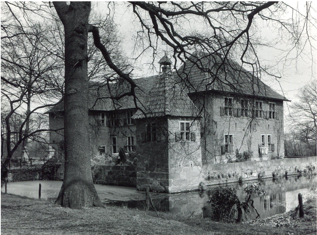
Breckelenkamp 1967, foto L. Sevenster, collectie W. Hoogeland.

Anders is het met de directe omgeving van het huis. Die heeft met name in de twintigste eeuw grote