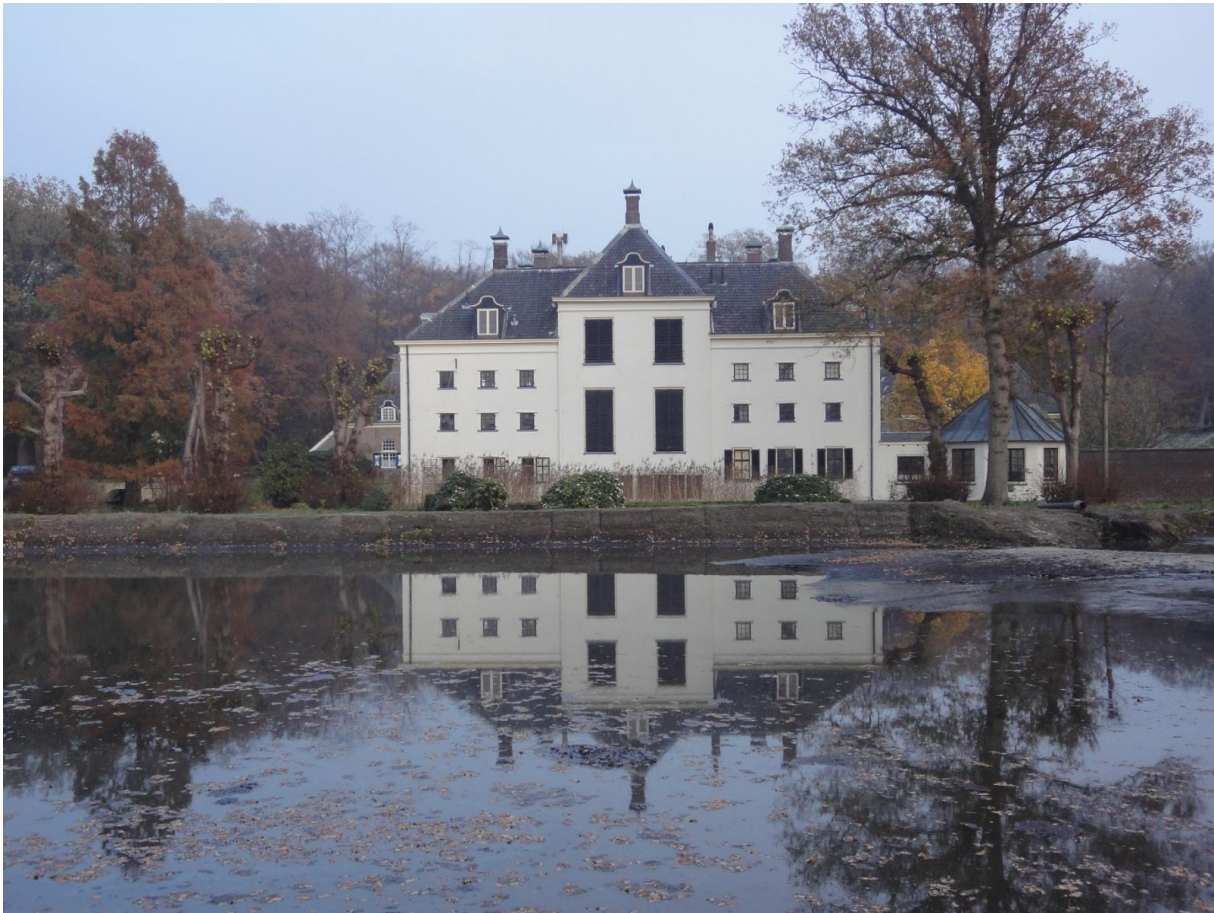
Deze spiegeling van het Huis Schoonheten zullen we niet vaak te zien krijgen. Opslag/bezinken van het slib. Hieronder de baggerwerkzaamheden in volle gang.