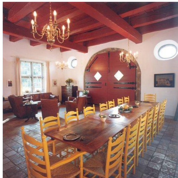
Kamer in de door Zegers in 1820 gebouwde vleugel