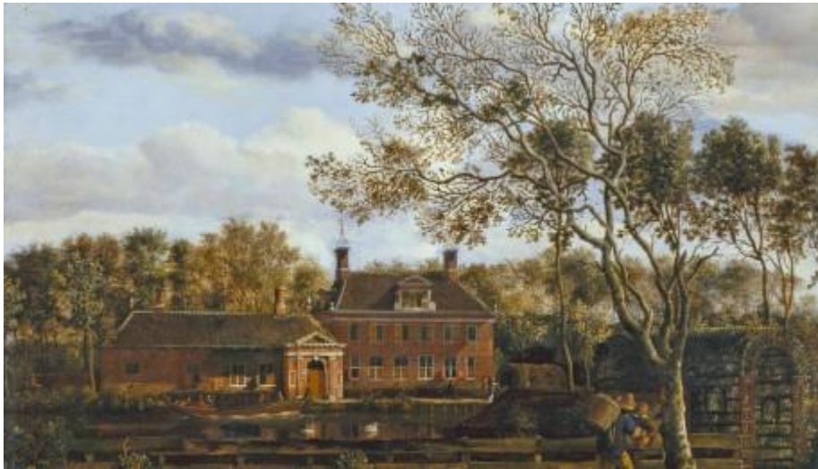
Buitenplaats Wolff en Hoeck in 1678 geschilderd door Jan van der Heyden. Deze buitenplaats bevond zich in de Purmer en is in de loop der tijd gesloopt.

De Stichting Themajaar Historische Buitenplaatsen 2012 is er op gericht om veel meer mensen in ons land bekend te maken met historische buitenplaatsen en daarmee aandacht te vragen voor het behoud van dit belangwekkend culturele erfgoed. Ooit was de buitenplaats een belangrijk fenomeen en belichaamden zij, vooral in de huidige Randstad, een bijzondere band tussen stad en land. In voorbije eeuwen telde Nederland vermoedelijk zesduizend of meer grote en kleine buitenplaatsen. Hiervan resteert nu nog slechts 10%. Deze circa 600 buitenplaatsen zijn in alle provincies te vinden.