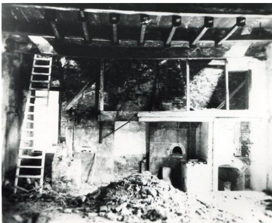
De sterk in verval verkerende keuken uit 1633 Foto's ca 1939.