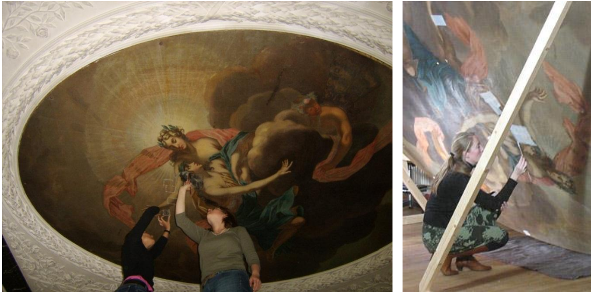
Restauratie van de plafondschildering.

verbonden. Een uniek voorbeeld van een buitenplaats die tot ver in de 20e eeuw bewoond was. "Uitgangspunt voor het bouwkundig herstel was terughoudend restaureren, waarbij behoud gaat boven vernieuwen. Uitgebreid onderzoek leidde tot keuzes die het gebouw, met zijn museale ruimten en afwerking, respecteren. Bij noodzakelijke herstelwerkzaamheden zijn traditionele materialen en technieken toegepast. Bij uitzondering zijn moderne compromissen toegevoegd", vertelt Jaap Hülsmann. De levensgeschiedenis is na de restauratie afleesbaar. Zo zijn de muren niet glad gestuukt, maar zijn scheuren zo goed mogelijk hersteld en zijn de afdrucken zichtbaar waar schilderijen hingen.